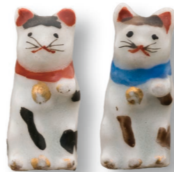
磁器人形招き猫 高さ2・3cm