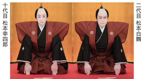
十代目 松本幸四郎

市久留米シティプラザ (☎0942・36・3000、FAX 0942・36・3087)