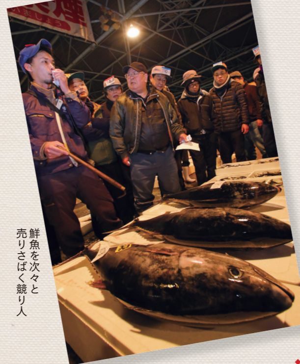
鮮魚を次々と売りさばく競り人

このコーナーは3月15日号掲載「3月生まれの赤ちゃん」まで終了します。長らくご愛読いただき、ありがとうございました。 ◎広報戦略課 (☎30-9119、FAX 30-9702)