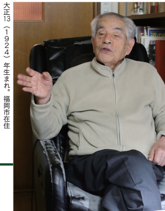
大正13(1924)年生まれ。福岡市在住