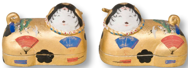
ひな道具犬管 高さ5・8cm