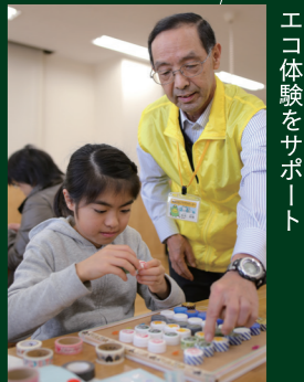
エコ体験をサポーター

サポーターは随時募集中。サポーター活動を見学することもできます。興味がある人は同課に問い合わせください