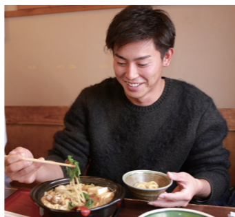
もつ鍋も好物と言う釜元選手