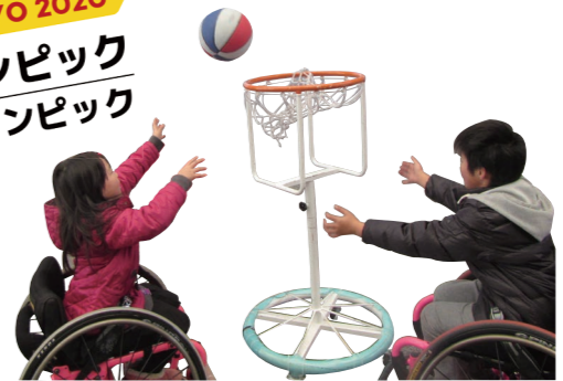
競技用の車いすでバスケットに挑戦