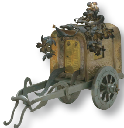
銀製ひな道具御所車 高さ6・5cm