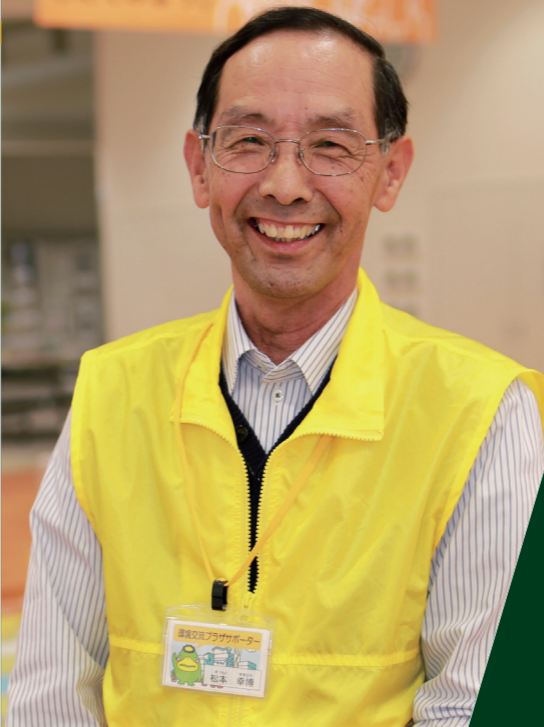
サポーター歴 2年 10カ月