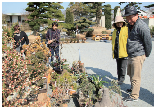
多くの来場者でにぎわった 昨年の様子

には、昨年好評だった久留米産ニシキゴイの販売や、地元の家産団体「キラリ倶楽部」による野菜の直売なども開催します。