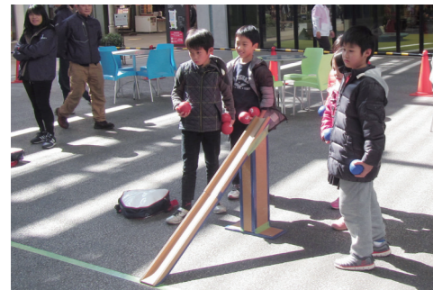
4ページに関連の記事があります