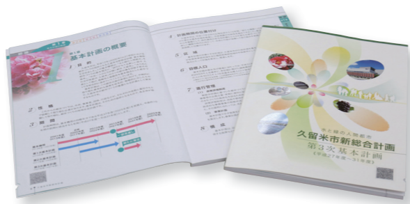
施策や都市づくりの目標をまとめた冊子

久留米市は、平成13年度に新総合計画を策定。27年度から令和元年度までを期間とする第3次基本計画でさまざまな政策を進めています。新総合計画に基づいた都市づくりを皆さんと共有し、協働のまちづくりを実現するため、政策評価制度を導入。30年度の取り組み成果や進捗状況をまとめました。意見や提案は問い合わせ先まで。 ◎総合政策課 (☎0942・309112、FAX0942・309703)