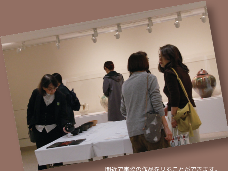
間近で実際の作品を見ることができます。中には作品に触れるコーナーも

11月21日から12月2日まで久留米市美術館で、全国重要無形文化財保持団体秀作展が14年ぶりに開かれました。