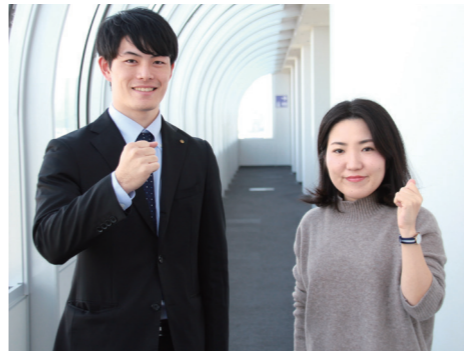
共に働く仲間を待っています

久留米に愛情を持ち、久留米のために働きたい職員を募集します。任期がある週30時間勤務の職員で、区分は一般事務職を15人と障害者対象の一般事務職1人です。期末勤労手当や通勤手当の支給もあります。仕事の内容は、各種申請の受け付けや事業の企画運営など、配属される場所です。正規模職員と同様の業務を行います。 ■受験資格 来年3月31日時点で