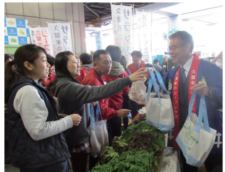
久留米産のリーフレタスなどを来場者に配布しました