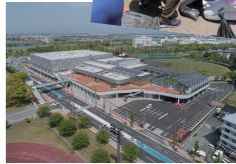
県と共同で建設した「久留米アリーナ」