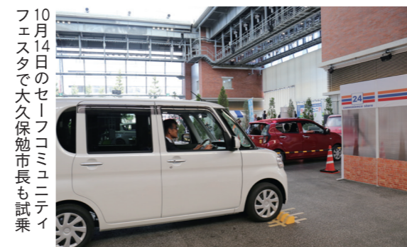
10月14日のセルフコミュニケーションフェスタで大久保勉市長も試乗

久留米市とダイハツ工業は、交通事故の防止に向け「後付け安全運転支援装置」を使った実証実験を開始。交通安全指導員の車や校区の青パトに、ペダルの踏み間違いによる重大事故を防ぐための装置や衝突警報装置を取り付けます。利用者へのアンケートで有効性や安心感などを検証します。 安全安心推進課 ☎0942・30・9094、FAX 0942・30・9706