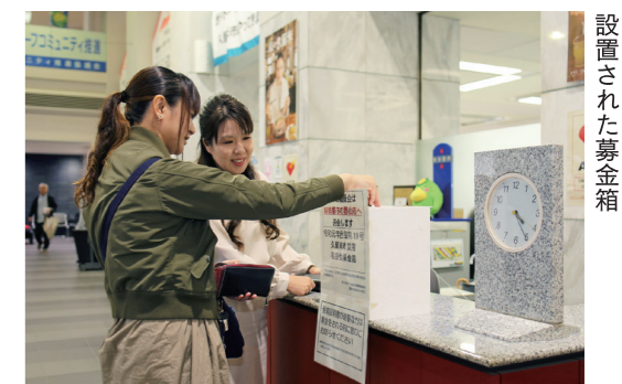
本庁舎の総合案内カウンターに設置された募金箱

台風19号で被災した姉妹都市・福島県郡山市を支援するため、久留米市は義援金の受け入れを開始しました。募金箱は、本庁舎1階総合案内、各総合支所、各市民センター、久留米シティプラザなど17カ所に設置しています。金融機関への口座振込もできます。期間は来年3月31日(火)まで。 総務課 ☎0942・30・9052、FAX 0942・30・9706