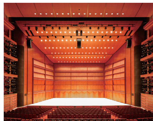
舞台の正面、左右、上部すべてを巨大な板で覆うことで、音を反射して美しい音色をつくりだす