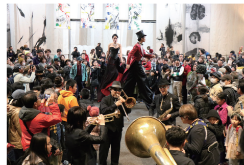
6ページに関連の記事があります