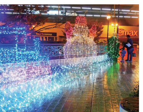
西鉄久留米駅東口広場 (昨年の様子)