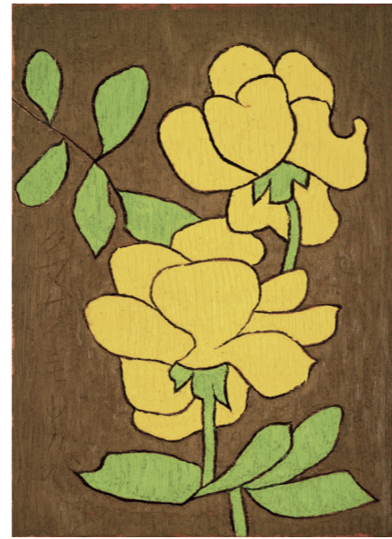
《薔薇》1971年 公益財団法人ひろしま美術館