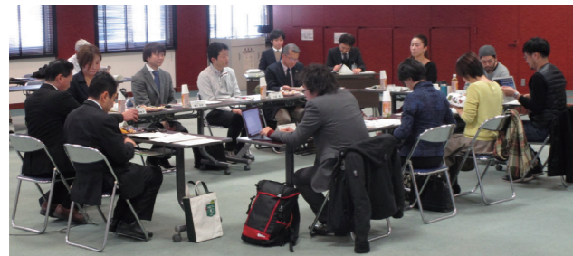
職業も年齢も違う参加者が、久留米のこれからの話し合いました