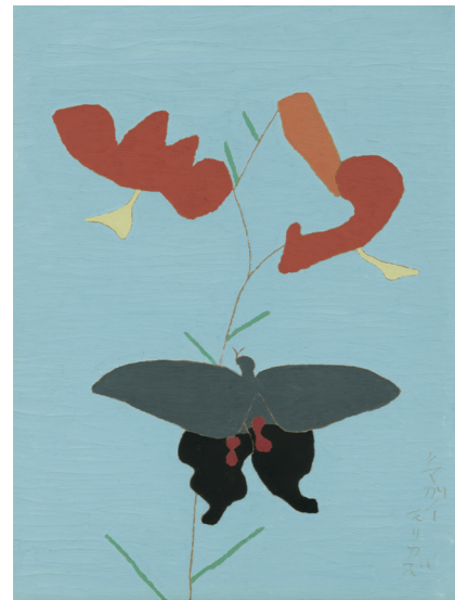
熊谷守一《鬼百合に揚羽蝶》1959年 東京国立近代美術館