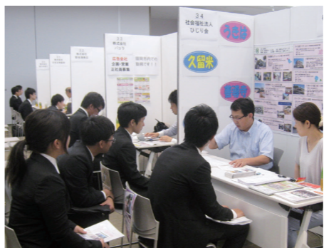
昨年の説明会の様子

参加企業など詳しくは、合同会社説明会事務局(西日本エリートスタツフ内、0942・46・1170) http://www.elite-staff.com) のホームページで紹介します。日時 8月11日(土)13時~16時 会場 久留米シティプラザ 大会議室 労政課(0942・30・9046、FAX 0942・30・9707)