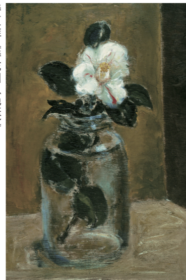
1957年 椿貞雄(椿花図(絶筆)) 米沢市上杉博物館