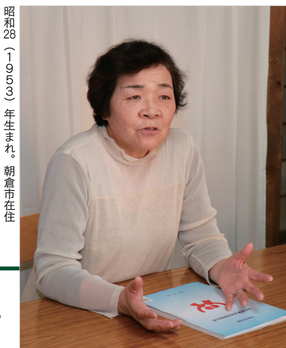
昭和28(1953)年生まれ。朝倉市在住

男女平等政策課 (☎0942・30・9044、FAX 0942・30・9703)