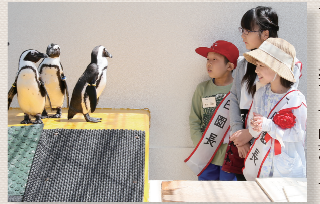
ペンギンを見学する一日園長の3人