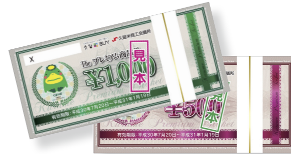
久留米商工会議所が発行する2種類のプレミアム付き商品券の見本

久留米商工会議所 (☎0942・30・9134、FAX 0942・30・9707)