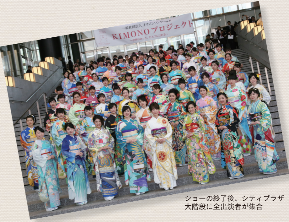
ショーの終了後、シティプラザ大階段に全出演者が集合

2020年の東京オリンピック・パラリンピックに向け、世界196カ国をイメージした着物を制作する「KIMONOプロジェクト」。100着が完成し、4月29日に久留米シティプラザで披露されました。市内の団体が、日本の伝統を発信するとともに、相手国を知りきっかけにと平成26年に開始。久留米高校生など100人が出演し、色鮮やかな着物をアピールしました。今後、五輪開催までの完成を目指します。