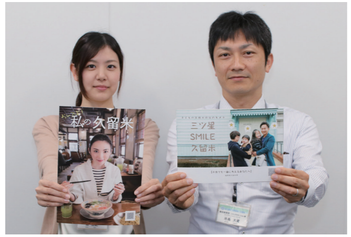
パンフレットは、田中麗奈さんが登場する魅力情報(左)と移住情報の2種類

久留米市は、全国への情報発信を強化するため、魅力情報と移住情報の2種類のパンフレットを新たに作成。併せてプロモーション特設サイトを開設しました。魅力情報パンフレットは、久留米ふるさと特別大使の田中麗奈さんが、食や文化・芸術などを紹介。福岡市の観光案内などで配布します。移住情報は、子育て世代向けに、子育てや医療などの生活環境を移住者の声を交えながら紹介。