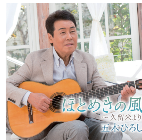
ほとめきの風 ～久留米より 五木ひろし