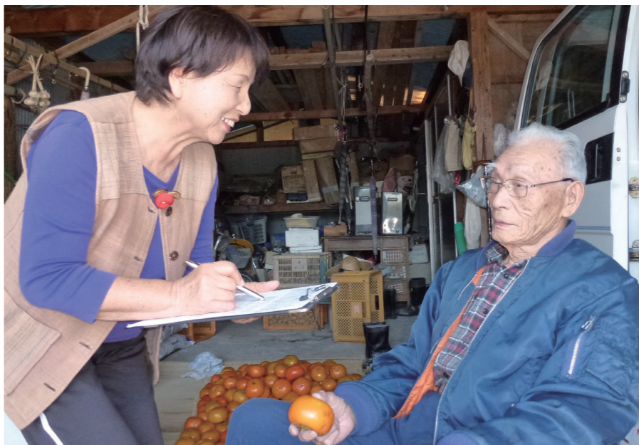
草野校区では、地域の高齢者の暮らしを把握するために、75歳以上の高齢者のみの世帯や1人暮らしの世帯を民生委員などが訪問。日ごろの困り事などを聞き取り調査しました。その結果、ごみ出しや病院への通院などに加え、庭木の枝切りなどのニーズがあることが分かりました

高齢になると、ごみ捨てや買い物など、日ごろの困り事が増えてきます。久留米市は、高齢者や障害のある人などを地域で支え合う仕組みづくりのため「支え合い推進会議」の全校区への設置を進めています。