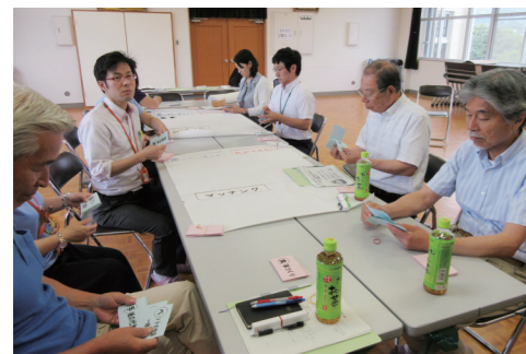
6ページに関連の記事があります