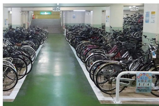
チャイルドシート付きの自転車なども止めやすくなりました

市は今後も、駐輪場の利用促進や放置自転車の解消に取り組んでいきます。 ☎交通政策課（☎0942・30・9092、FAX0942・30・9714）