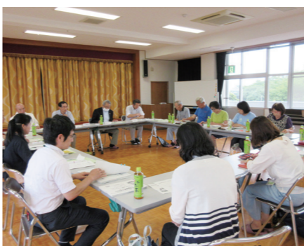
会議では、委員が活発に意見を交わします

調査の結果を受け、新たな担い手が活動する場を創設。ボランティア養成講座を開き、「草野支え愛クラブ」を立ち上げる予定です。