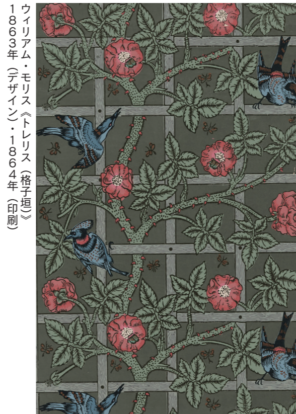
ウィリアム・モリス《トレリス(格子垣)》 1863年(デザイン)・1864年(印刷)