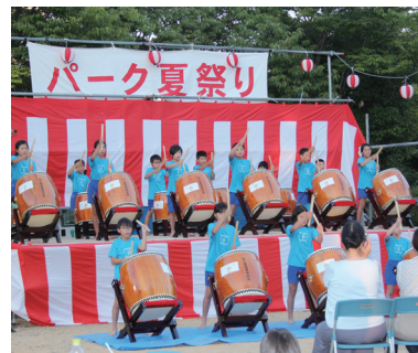
パークタウン自治会夏祭りの様子