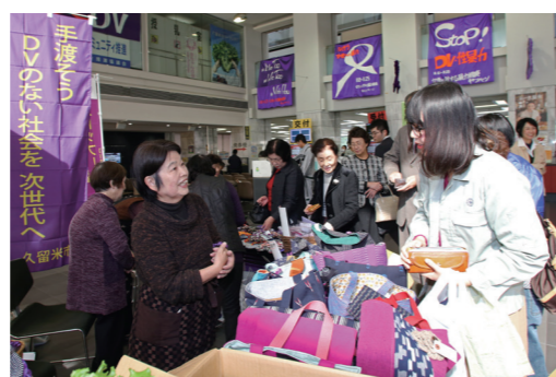
お客さんとのやりとりの中で、活動の大切さなども伝えました

本庁舎ロビーで、11月14日、パールマルシェが開催されました。女性に対する暴力根絶のシンボル「パールリボン」の普及啓発と、女性の自立を支援する団体の活動支援を目的とした催しです。久留米餅のパールリボンや野菜、小物などが販売されました。 会場には、紫色と児童虐待防止を訴えるオレンジ色のリボンで飾られたツリーも設置されました。 ☎男女平等政策課（☎0942・30・9044、FAX0942・30・9703）