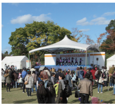
広い会場内に設置されたステージ。ビンゴ大会や餅まきなど、来場者が一緒に参加する催しもあります

■内容 17日・触れ合い動物園、ビンゴ大会、サタデー太鼓フィーバーのステージなど。18日・植木苗木の競り市、Viewoによるアクロバットステージなど 両日とも11時と14時から、数量限定で田主丸産キャベツとミニ白菜の特売会を実施します。