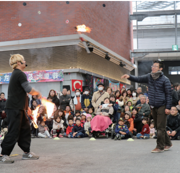
観客を引き込むと一体感も増す

「どういうところに面白さがあるのですか 人が集中できるのは、30分くらいと言われます。テ