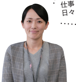
仕事と育児の両立に日々、奮闘中

くいきませんでした。そうですね。冷静な時に練習しておくといいですね。そうすれば、いざという時うまく使えるようになります。ただ、これができるのは少しでも気持ちに余裕がある時。疲れて余裕が無い時は、早く寝る、長くお風呂に入るなど、自分が少しでも休めることを取り入れてみてください。いろいろな減っていい循環につながります。