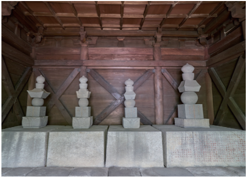
春林院霊屋の内部。初代豊氏などの石塔が安置されています

県内の建築物が国の重要文化財に指定されるのは40件目。市内では3件目です。◎文化財保護課(☎0942・30・9322、FAX 0942・30・9714)