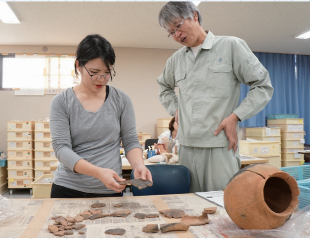
出土品の復元作業を体験。微妙な色の違いや、断片の形状をヒントに、つなぎ合わせます

吉野ヶ里遺跡周辺で見かけるような発掘作業を、市内でも行っているのを見ました。久留米市の文化財を守る取り組みなどについて、文化財保護課の職員に話を聞きました。