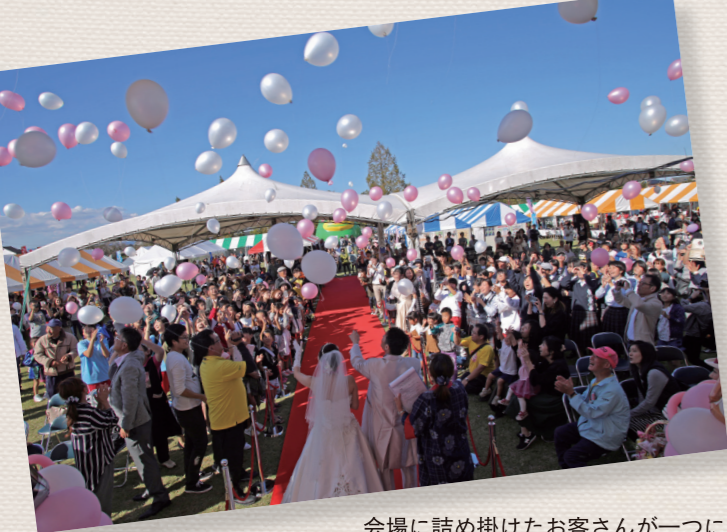
会場に詰め掛けたお客さんが一つになって新郎新婦を祝福しました