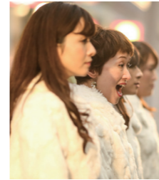
ルミネナス Luminous 女性歌手4人のコーラス