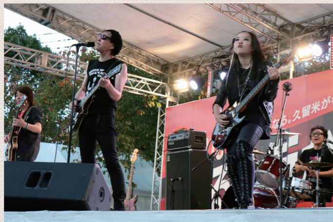
ローリングストーンズの往年の名曲を熱演