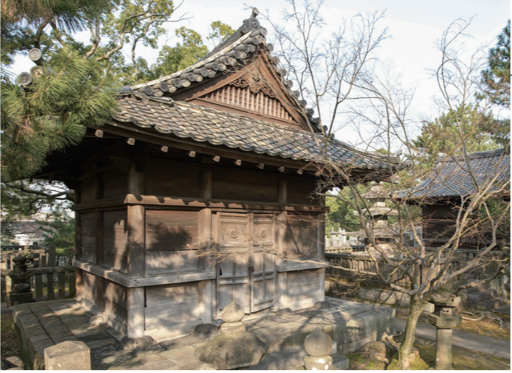
国重要文化財に指定される有馬家霊屋の一つ 梅林院位牌廟

有馬家の菩提寺・梅林寺にある「有馬家霊屋」5棟が国の重要文化財に指定される見通しとなりました。有馬家霊屋は、江戸時代に建てられた、有馬家の歴代藩主の墓や位牌を納めた霊廟という建物です。大名家の墓所で当時の建物が残っているのは全国的にも