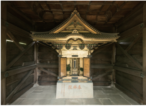
位牌廟の中にある宮殿。内部に位牌が納められています