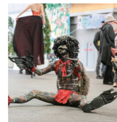
Okk もののけの世界から来たカップ