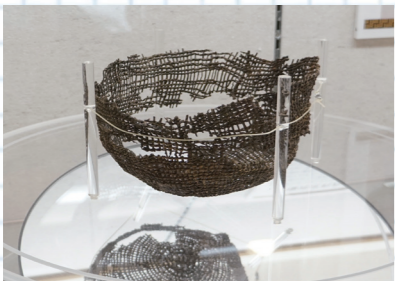
編み籠は、特別な薬剤で繊維を壊さないように復元したそうです

—— 久留米ではどんな物が出てくるのか。例えば、上津バイパス工事の事前調査では、縄文時代の人たちが、採集したどんぐりなどの木の実を入れていた編み籠が発掘されました。編み籠は、かざらなどで作られていて、本来は自然に返ってしまふもので