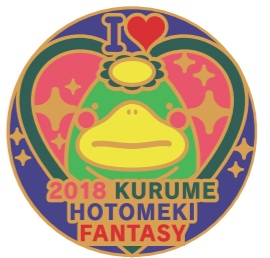
オリジナルピンバッジデザインは一般公募で決定

オリジナルサポーターピンバッジを販売。収益金は、イルミネーション設置費用などに活用します。西鉄久留米駅観光案内所や地場産くるめJR久留米店などで、1個1000円で購