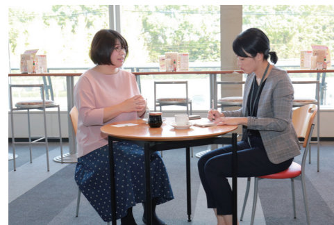
8ページに関連の記事があります

☎広報戦略課 (☎830・8520 住所記入不要、✉kouhou@city.kurume.fukuoka.jp)