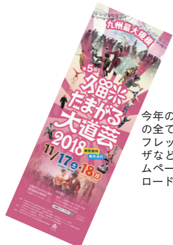
今年のだまがる大道芸の全てが詰まったパンフレット。シティブラザなどで配布中。ホームページからもダウンロードできます

ボランティアの皆さんも活躍。芸人さんが街に繰り出すお手伝いをします。大道芸の輪をどんどん広げたいですね。