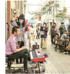
EPPAI& マサトモジャ 生演奏で手品やコメディーも