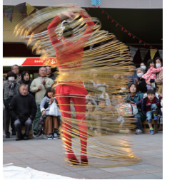
中国雑技芸術団 想像の上をいく技の数々