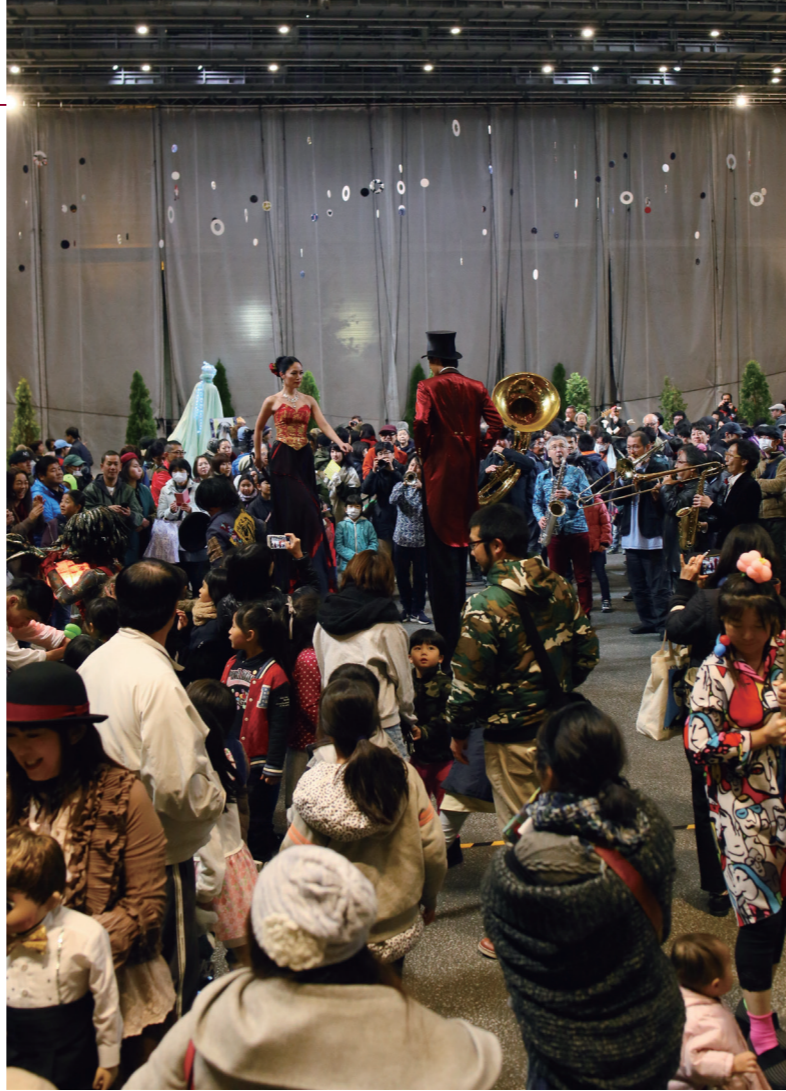
土曜の夜、六角堂にすべての芸人たちが集まり、観客と一体になる「夜会」(昨年の様子)

その後、横浜の「野毛大道芸」を立ち上げることにあります。さまざまに出し物を選んで見る、今の祭りの形ができました。