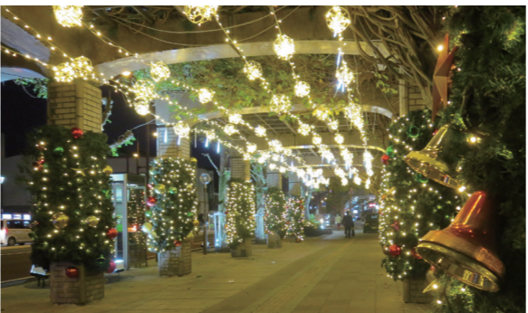
明治通りの藤棚も光で彩られます(昨年の様子)