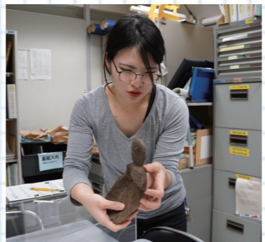
縄文時代の人々が作った木製のスコップを実際に触らせてもらいました

ではどんなことをするの？ 発掘作業で出土した遺物の復元、展示を行っています。復元作業では発掘した土器などの破片を組み合わせていきます。破片は全てそろっている