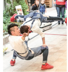
SUKE3&SYU 笑いを交えたアクロバット