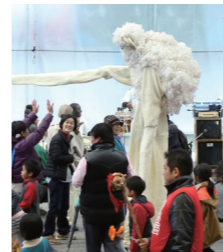
せせらぎ 不思議の森から来たたさすらいの羊