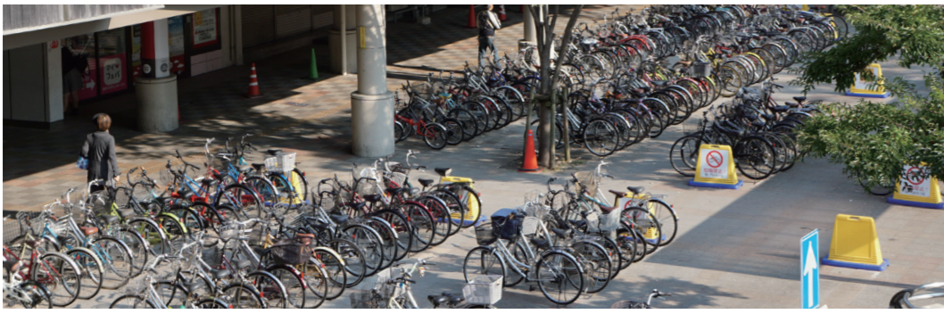
西鉄久留米駅東口広場。放置自転車が多くの広場として利用できない状態です

耳納の市の情報は、イン스타그램アカウント「minounoichih」でも随時発信しています。◎田主丸耳納の市実行委員会(田主丸総合支所産業振興課内) ☎0943・72・2110、☎0943・73・2288